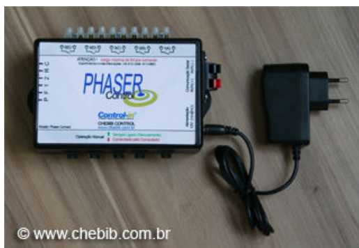
<< Foto do Multi-Phaser

O esquema acima foi elaborado utilizando-se de contatores com bobina 220Vac (Fase - Fase), mas pode ser montado com bobinas 110Vac (Fase - Neutro), entendendo-se como Neutro as ligações da Fase B.